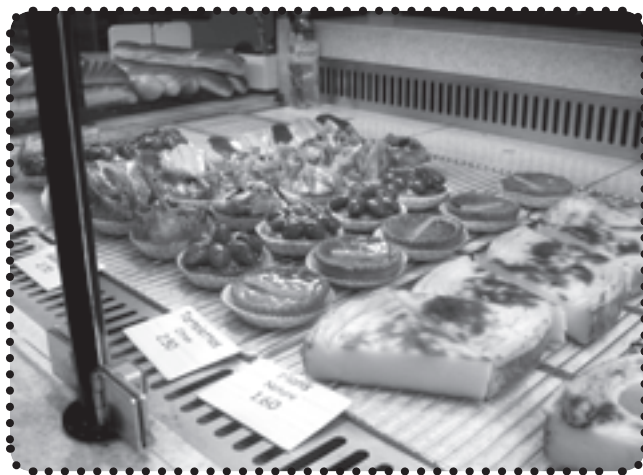
Je choisis une tartelette aux fraises.